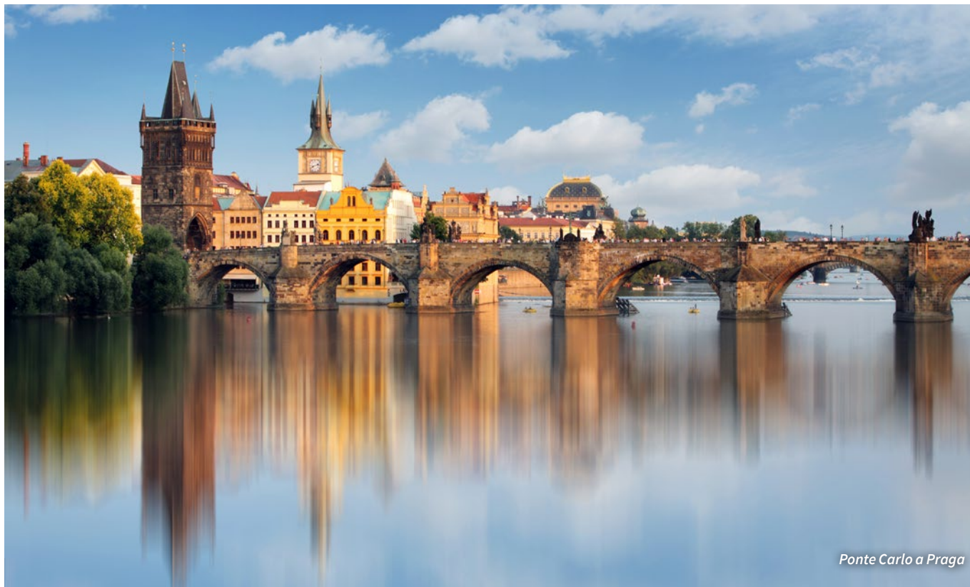
Ponte Carlo a Praga